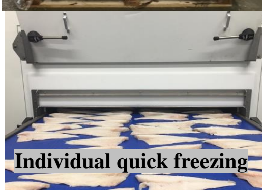
Individual quick freezing