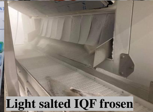
Light salted IQF frozen