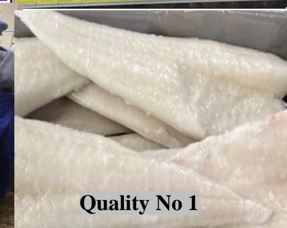
Quality No 1