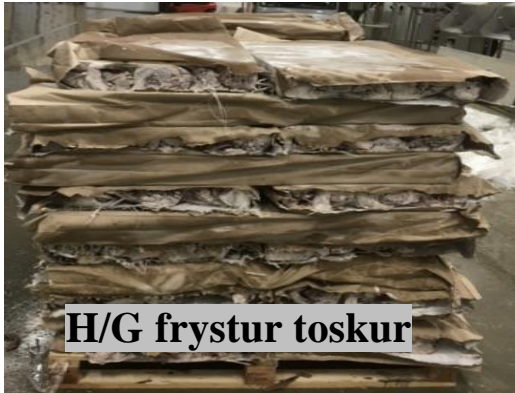
H/G frystur toskur