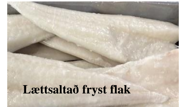
Lættsaltað fryst flak